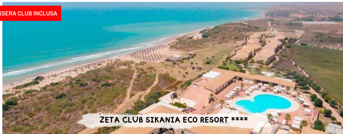
ZETA CLUB SIKANIA ECO RESORT ****