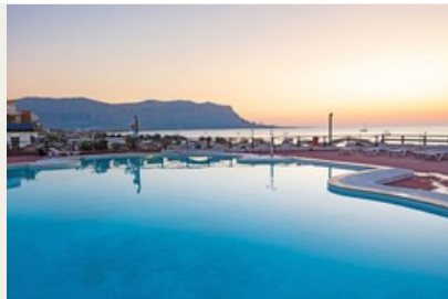
La formula Comfort Plus prevede postazioni dell'ombrellone dalla prima alla terza fila.

PISCINE: Una piscina per adulti e per bambini nell'area Belvedere e una piscina per adulti ed una per bambini nell'area Relax.