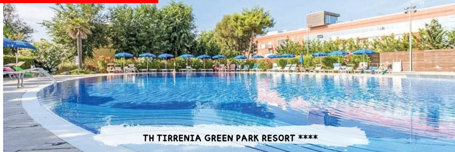
TH TIRRENIA GREEN PARK RESORT ****

PRENOTA PRIMA GARANTITO FINO AL 15 MARZO