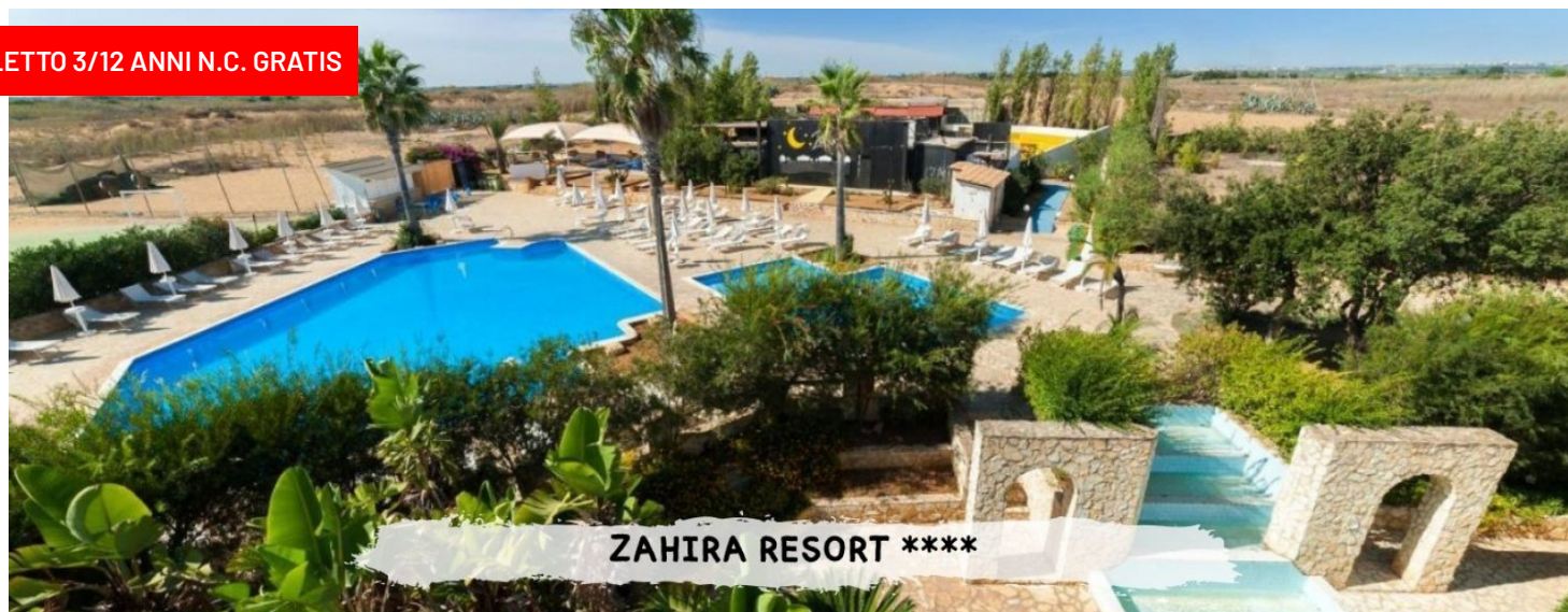
ZAHIRA RESORT ****