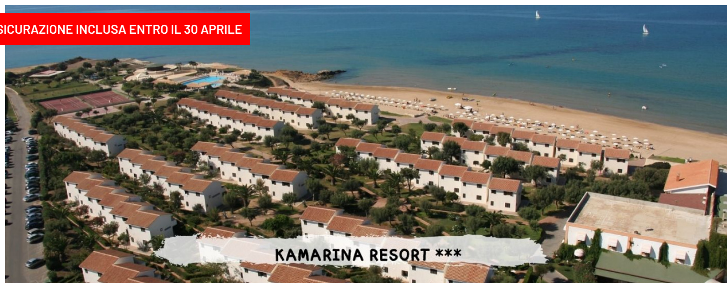
KAMARINA RESORT ***

ASSICURAZIONE INCLUSA ENTRO IL 30 APRILE