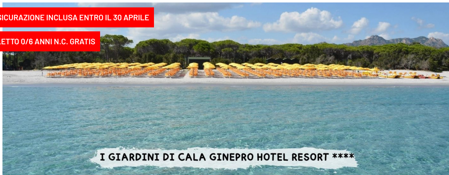
I GIARDINI DI CALA GINEPRO HOTEL RESORT ****