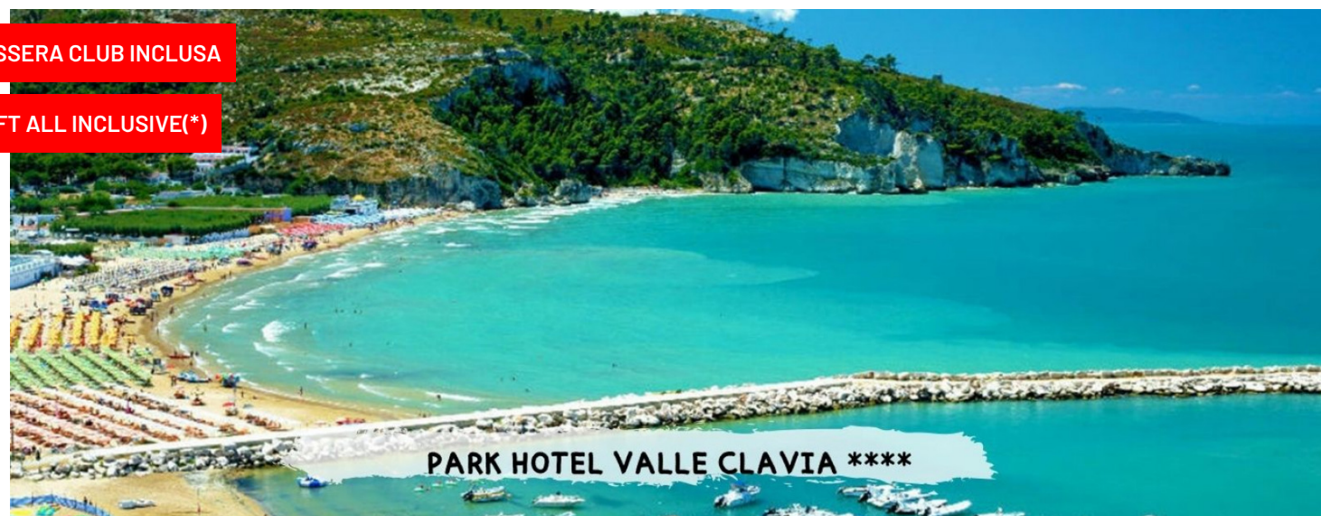
PARK HOTEL VALLE CLAVIA ****