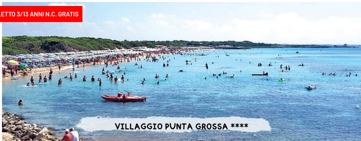
VILLAGGIO PUNTA GROSSA ****