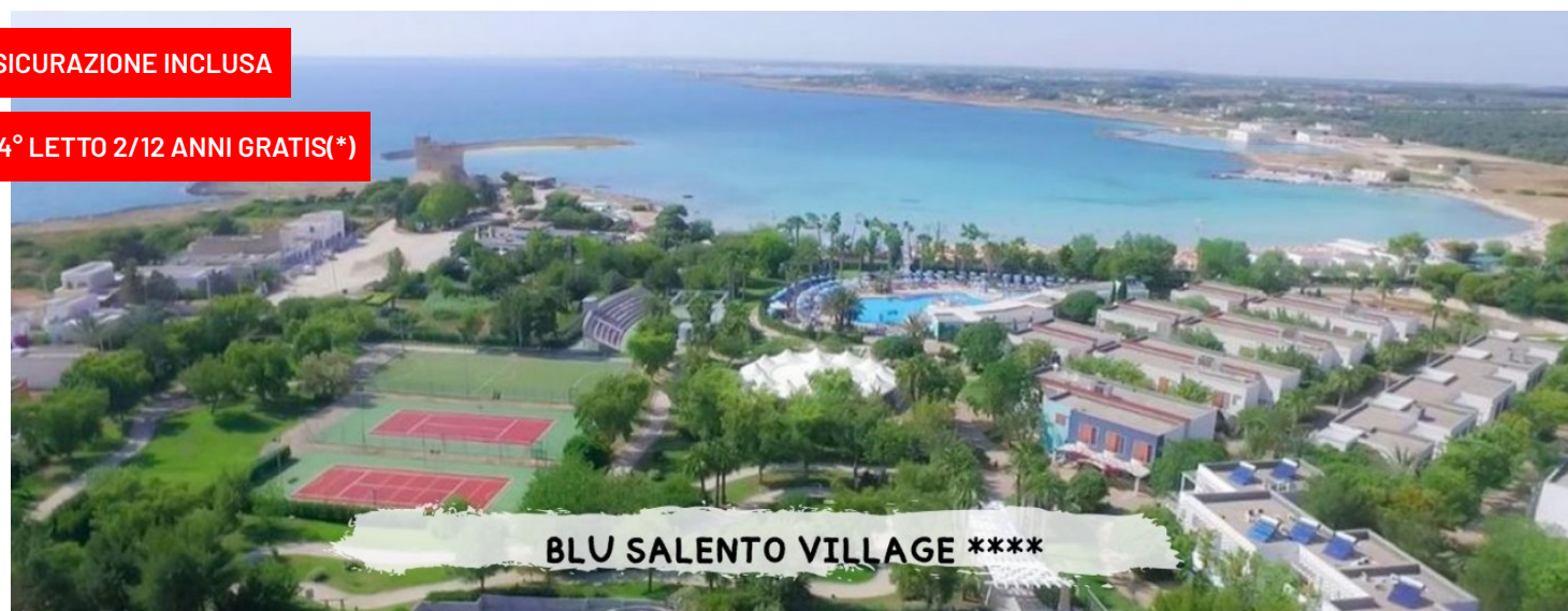
BLU SALENTO VILLAGE ****