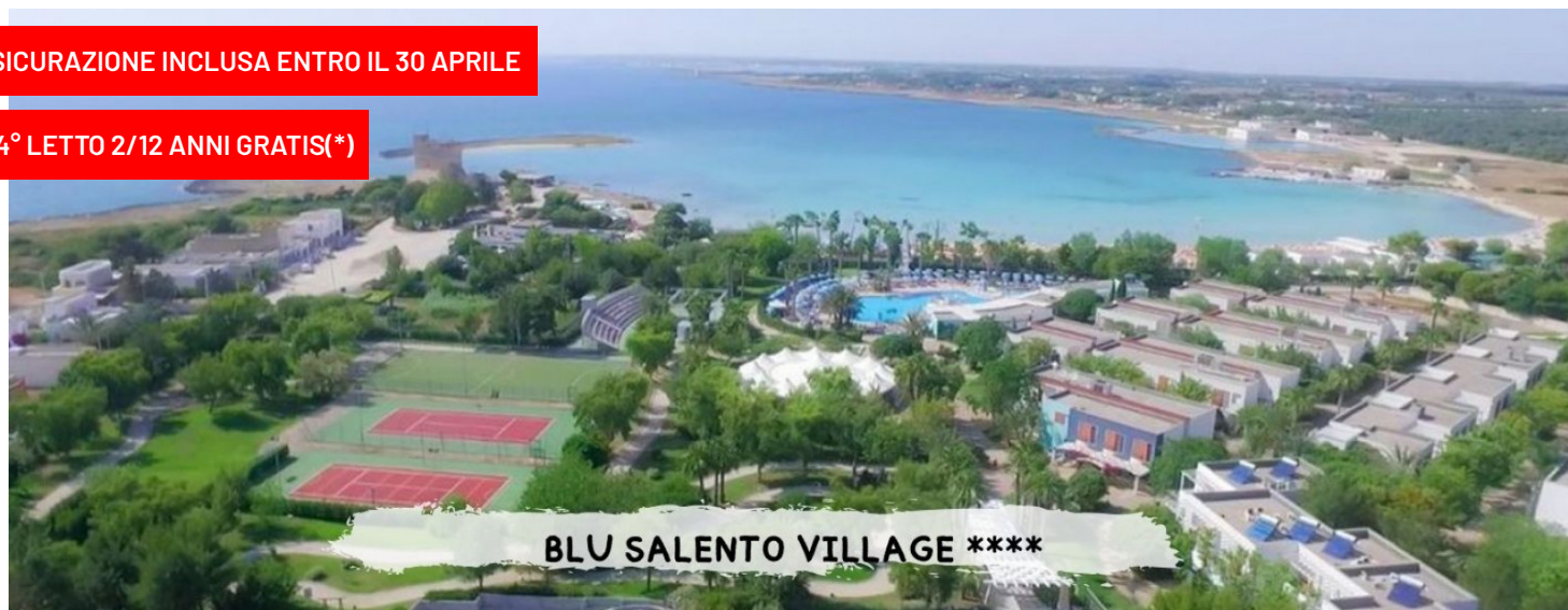
BLU SALENTO VILLAGE ****