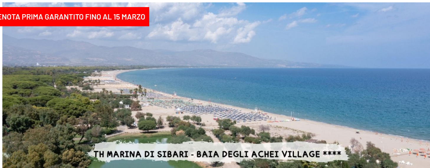
TH MARINA DI SIBARI - BAIA DEGLI ACHEI VILLAGE ****

PRENOTA PRIMA GARANTITO FINO AL 15 MARZO