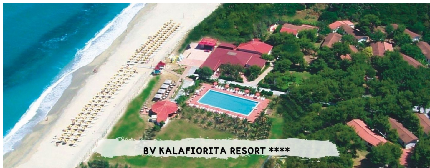
BV KALAFIORITA RESORT ****