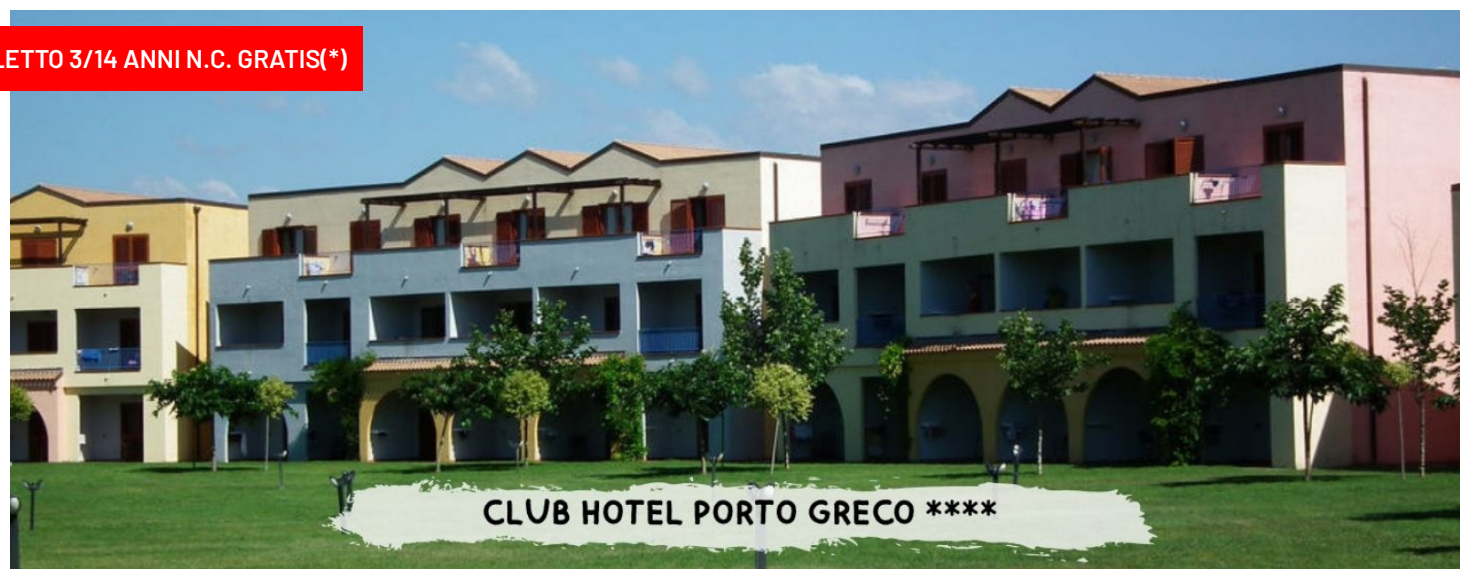
CLUB HOTEL PORTO GRECO ****