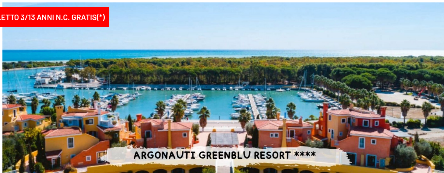
ARGONAUTI GREENBLU RESORT ****