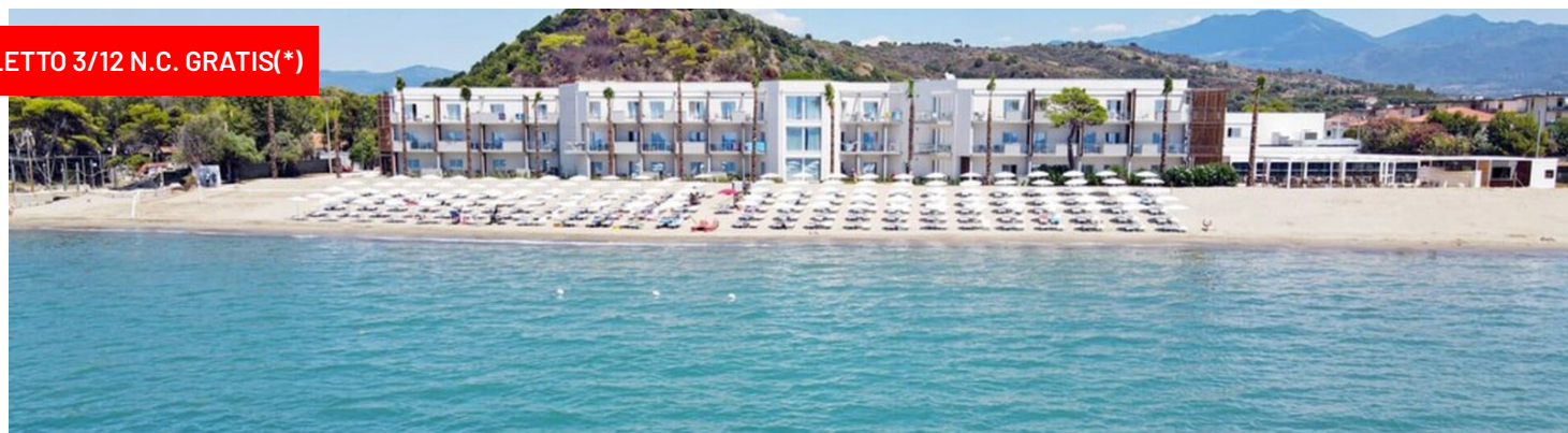
Quote settimanali per persona in camera Comfort Vista Parco in Pensione Completa